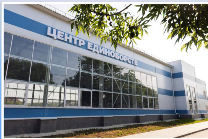
Физкультурно-оздоровительного комплекса ГБУ ДО РК «Спортивная школа № 3 имени Николая Тимофеевича Гостева» в селе Доброе

С 2019 года на территории Добровского сельского поселения построено 23 новых современных детских игровых и 5 спортивные площадки.