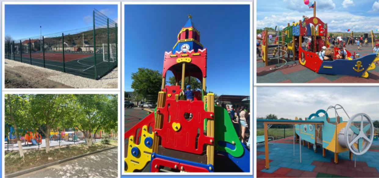
Современные детские игровые и спортивные площадки в с. Перевальное, Доброе, Заречное, Пионерское, Андрусово, Лозовое и Краснолесье.

С 2019 года на территории Добровского сельского поселения построено 23 новых современных детских игровых и 5 спортивные площадки.