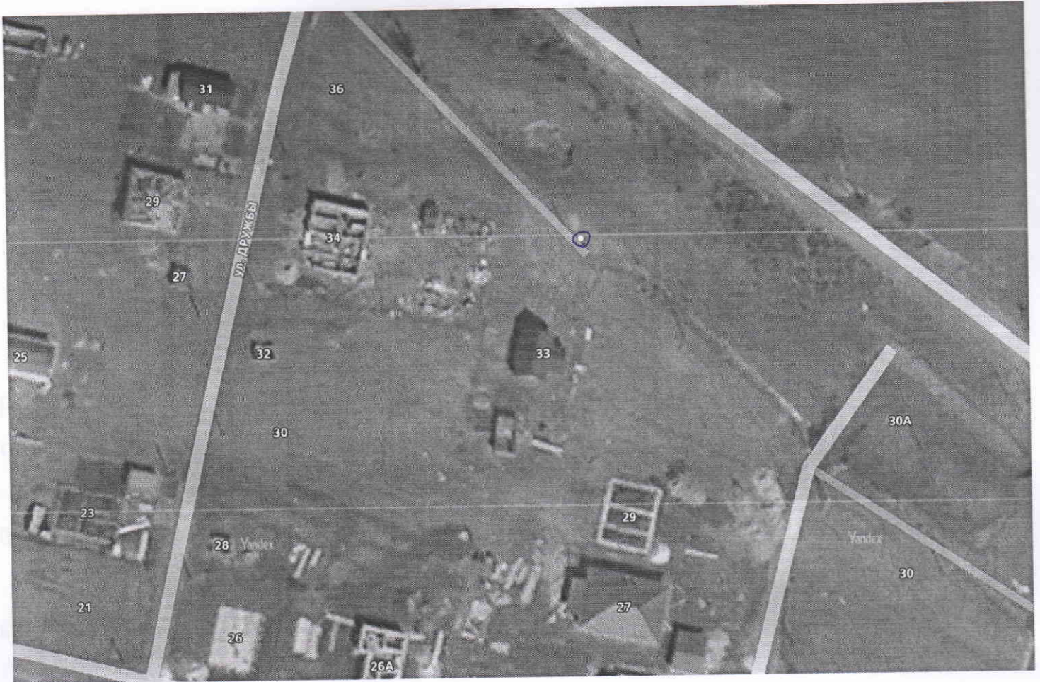
СХЕМА УЧАСТКА С НАНЕСЕНИЕМ ЗЕЛЕННЫХ НАСАЖДЕНИЙ, ПОДЛЕЖАЩИХ ВЫРУБКЕ

Приложение к разрешению на право вырубki зеленых насаждений Регистрационный № 9 Дата: « 09 » Марта 2026 г.